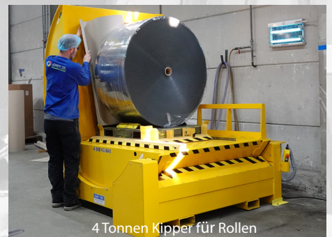
4 Tonnen Kipper für Rollen