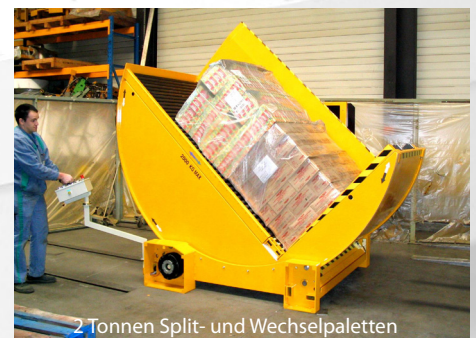
2 Tonnen Split- und Wechselpaletten