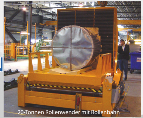
20-Tonnen Rollenwender mit Rollenbahn