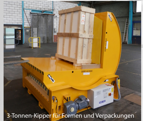
3-Tonnen-Kipper für Formen und Verpackungen