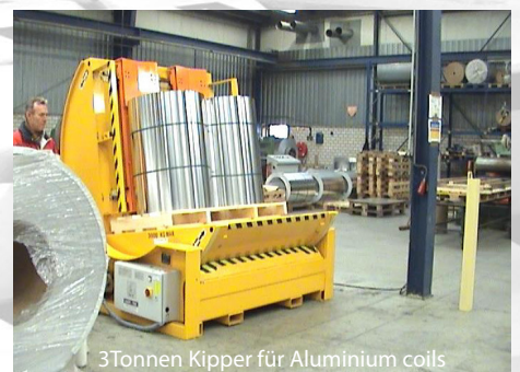
3Tonnen Kipper für Aluminium coils