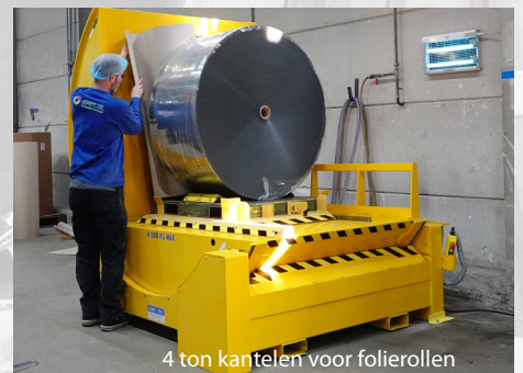
4 ton kantelen voor folierollen