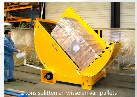
2 tons splitsen en wisselen van pallets