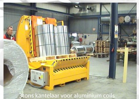
3tons kantelaar voor aluminium coils