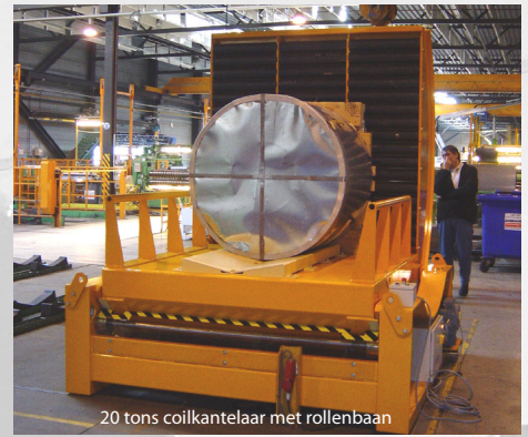
20 tons coilkantelaar met rollenbaan