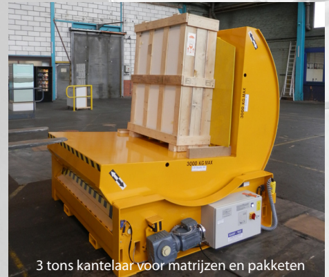
3 tons kantelaar voor matrijzen en pakketen